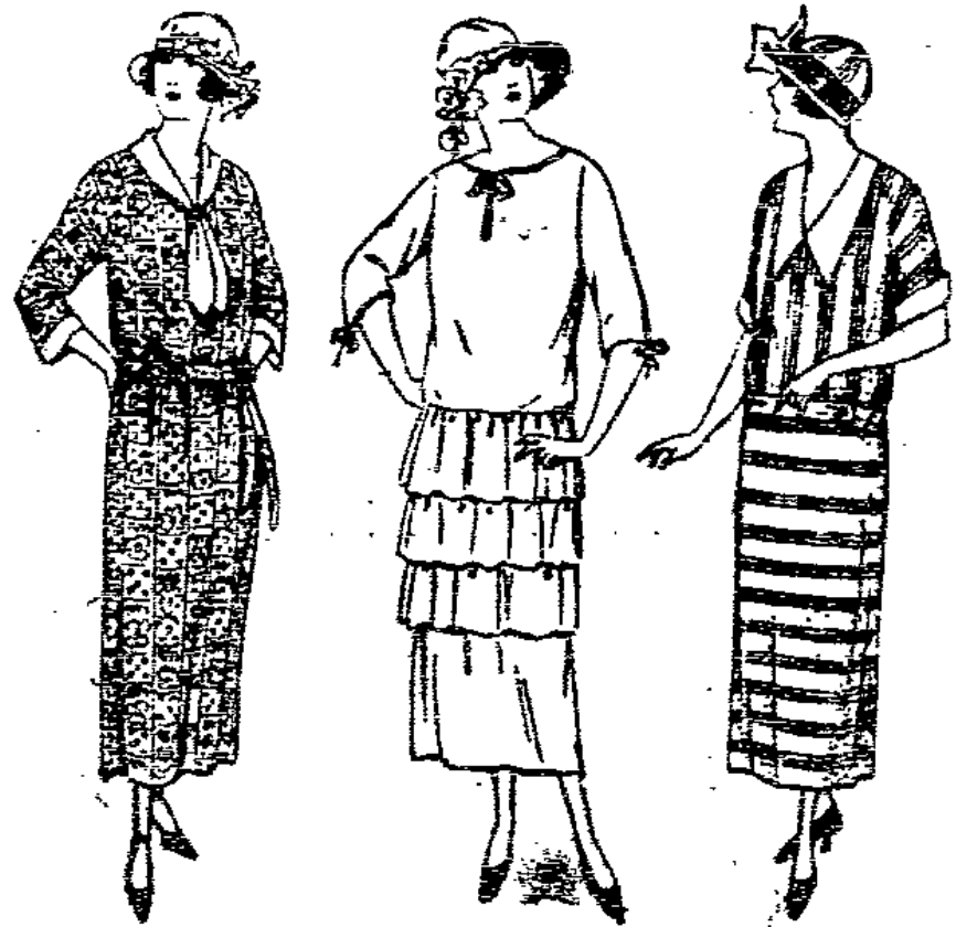
Mario reizender Mousseline mit weißen Schifferknöten 10 Mark Emma effektvolle feinste Popeline, helle Pastellfarben, 3-fach Volants 27 Mark Grete feiner Frotté, gestreift mit weitem Vordrucken 20 Mark