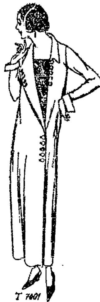
T 7601 Mantelkleid aus elefantengrauem Wollrip oder ähnlichem Stoff für ältere Damen. Das Kleid ist durchgehend ge- schlitten, in der tief gestellten Falllinie ist seine Weite durch Abnäher eingehalten. Der Rand des rechten, übertretenden Vor- derteils, unten durch Knöpfe gehalten, ist oben zum Revers umgebügelt. Darunter wird ein gemustertes oder gesticktes Ein- satzstück sichtbar. Erforderlich sind: etwa 4 m Rip, doppelt breit.