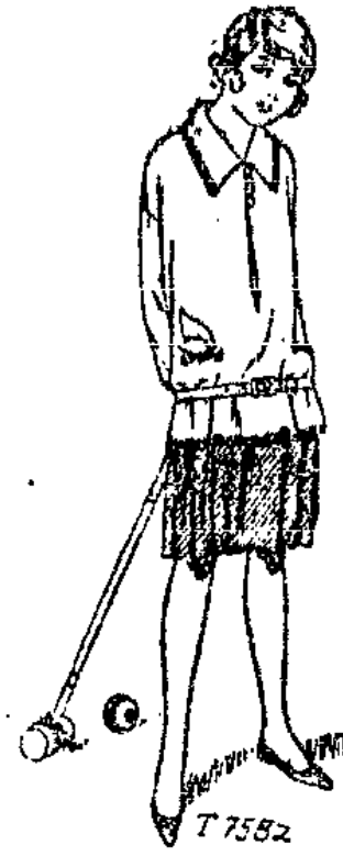
T 7582 Blusenkleid für Mädchen von 8 bis 10 Jahren. Zu einem Faltenrock aus blauem Twill, der einem Futterleichen an- gesetzt wird, eine Schößhuse aus Krepp, deren Weite durch einen schmalen Leder- gürtel zusammengehalten wird. Die Ränder sind mit bunten Strichen gestützt, den Schutz in der vorderen Mitte schließen Knöpfe und Schlingen. Erforderlich etwa: 1,50 m Twill, doppelt breit und 1 m Krepp 90 cm breit.

Lyon-Schnitt T 7601, Größe 46, 75 Pfennig (evtl. zuzüglich 5 Pfennig Porto)