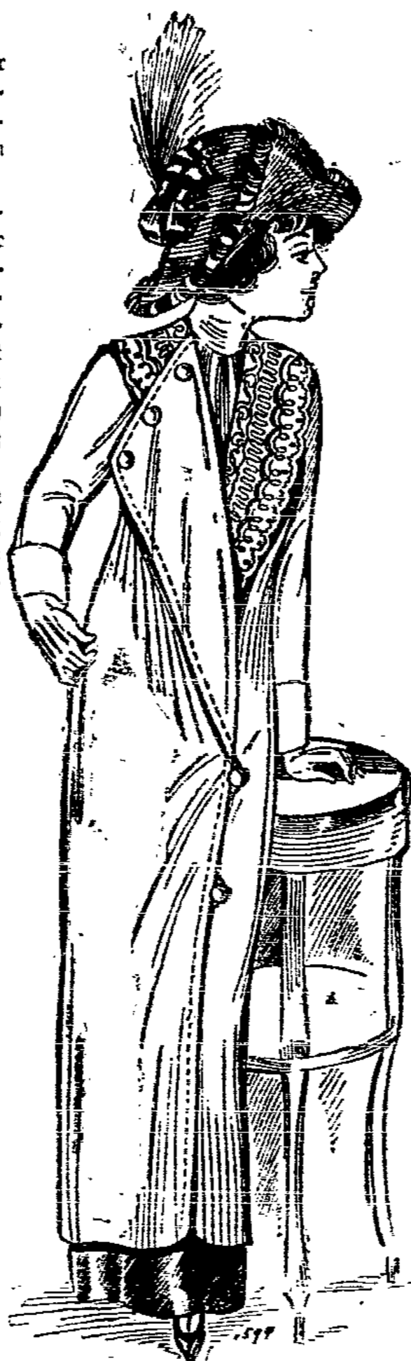
1594. Langer Mantel aus lila Tuch. Zweiknopfschluß. Gut mit Seidenverzierung und Reihengefied.

Qualität, desto geschmackvoller und exquisiter kann die Form bezw. die Bearbeitung sein. Ferner kann man eine der wunderbaren, abgeschattierten Farben wählen, die gewöhnlich nur in teuren Qualitäten künstlich sind. Und dem teuren Stoff und der geschmackvollen Bearbeitung passen Seidenfütter und Garnitur sich an.