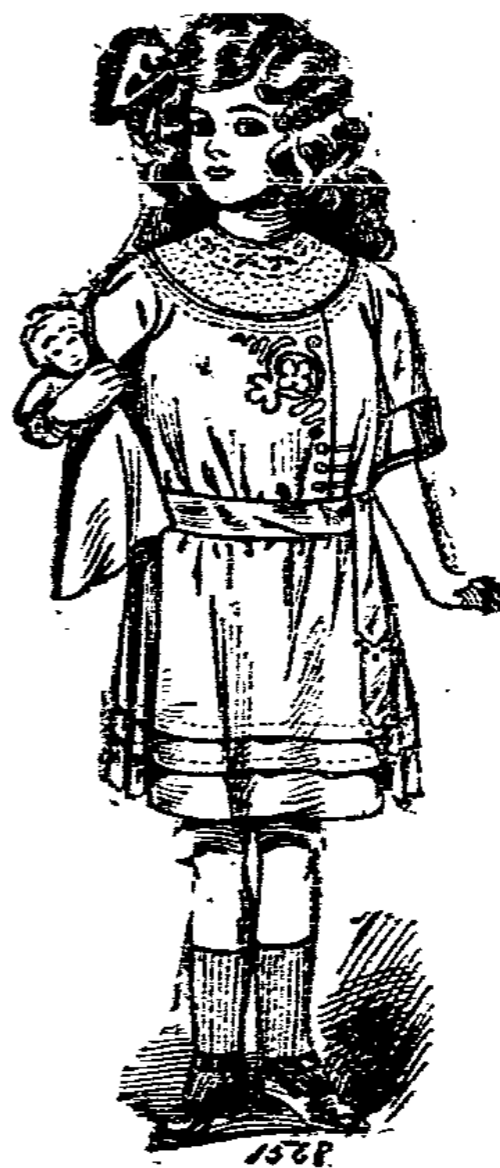
1568. Kleidchen mit Spitzenpasse für Mädchen von 6-8 Jahren.

1569. Einfaches Kleidchen aus feinem Wolstoff für Mädchen von 8-10 Jahren. Die mit kleinem Etschragen versehene Bluse hat als Garnitur einen zwischen Falten eingelegten, schottischen Seiden-streifen, womit auch die Manschetten und der Kragen garniert werden. Fern hat die Bluse eine breite Etschfalte mit je einer Plüschfalte als Garnitur. Der Rod ist in Falten geordnet und der Bluse ange-seht; ein Gürtel aus dem Stoff des Kleid-chen-s kann auch einem Futterkleidchen ange-arbeitet werden, und weil der vor-liegenden Bluse kann auch eine Netrosen-bluse getragen werden. Aber man fertigt zu einem schon vorhandenen Futterkleid-chen nur die Bluse aus corall. ehweischen-dem Stoff an.