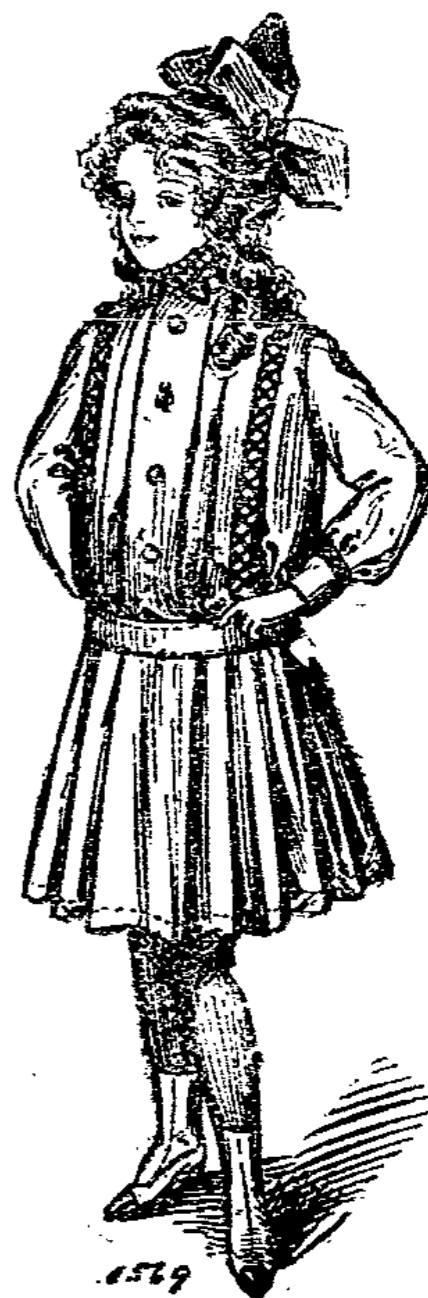
1569. Einfaches Kleidchen aus einem Wolstoff für Mädchen von 8-10 Jahren.