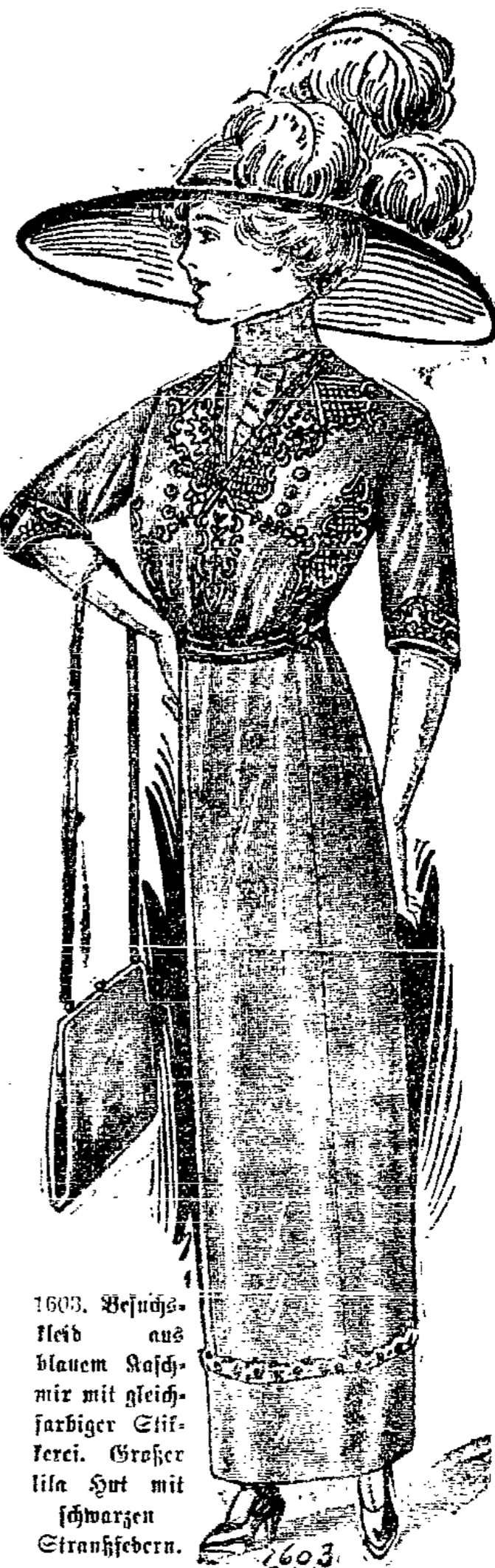
1603. Besuchs-kleid aus blauem Kaschmir mit gleichfarbiger Stickerei. Großer lila Hut mit schwarzen Stranfhebern.

1603. Besuchskleid aus blauem Kaschmir mit gleichfarbiger Stickerei. Glatte Taille mit eingesehten Ärmeln. Taß und Etschragen aus Taß. Glatte Rod mit Besatzstreifen und schmalem, hochstehenden Volant. Gefalteter Seidengürtel.