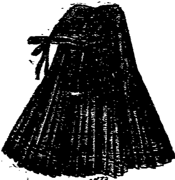
1473. Unterröd aus Chamelion-Lappet mit breitem gebrauntem Plüsch.

Lehter besteht zur Ede abgemäht, den Schürzen-teil, sprundet ihn und begrenzt die Trögerteile. Der Stickereibolant ver-schmücker sich in Leisten-fäden. Eine schmale Biese bedt überall den Kofel.