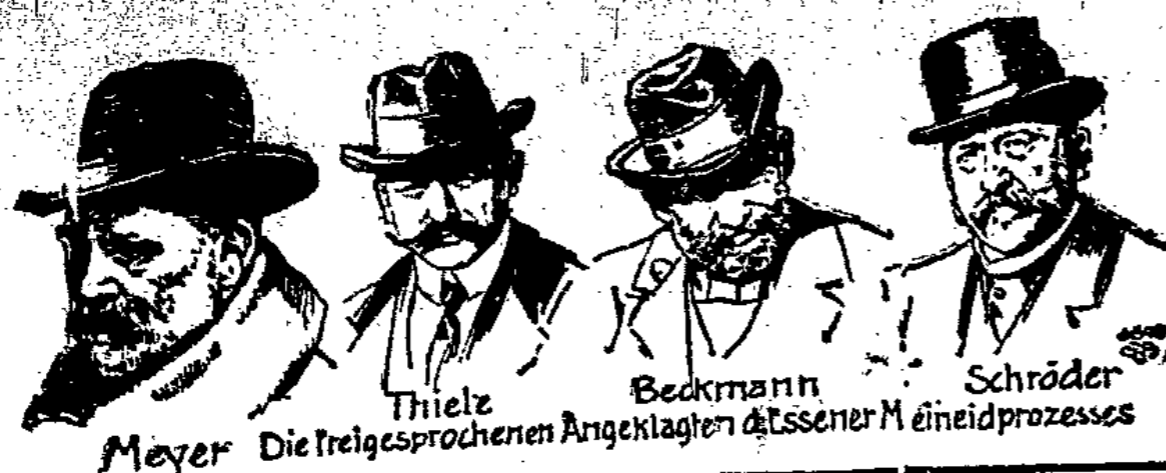
Meyer Die freigesprochenen Angeklagten des Essener M. einidprozesses