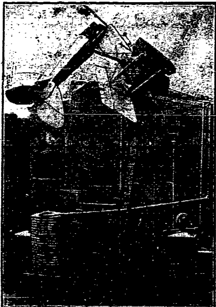
Ist der Flugschüler dieses verunglückten Flugzeuges; kurz nach dem Start rutschte er mit seiner Maschine ab, fiel auf das Dach eines Flugzeugschuppens und kam mit dem Schrecken davon.

Prügel ein „Erziehungsmittel“, auf das er auch gegenüber der Jugend nicht verzichten will. Die Tatsache, daß namentlich Jugendliche, die sich aktiv in der kommunistischen Jugendbewegung betätigen, in Fürsorgeerziehung überwiesen werden, zeigt das Bestreben kapitalistischer Staatsorgane, der revolutionär eingestellten Jugend den politischen Kampfwillen auszuprügeln. Allerdings ein vergebliches Unterfangen!